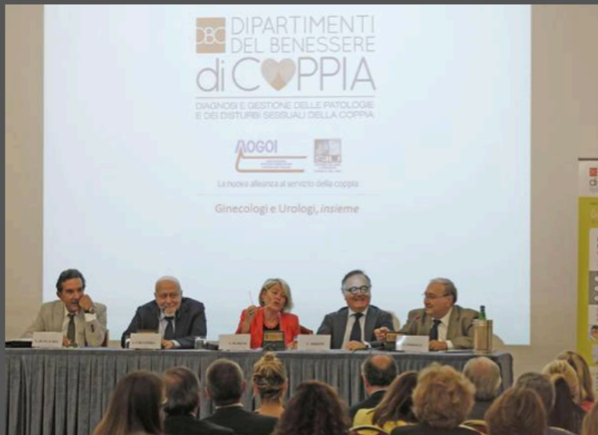
Al via 'Pronto soccorso' per problemi sessuali delle coppie

NAPOLI - Un pronto soccorso dove non si fanno lastre né si ingessature ma si parla dei propri problemi sessuali. Stanno per partire, negli ospedali pubblici di diverse città d'Italia, i primi pronto intervento della coppia, ovvero Dipartimenti espressamente dedicati al Benessere sotto le lenzuola. Un problema non da poco, visto che problemi sessuali come eiaculazione precoce, disfunzioni erettile, calo del desiderio, dolore al momento della penetrazione, sono all'origine del 20% delle separazioni, della crisi di circa 800.000 coppie e di qualcosa come 20mila matrimoni bianchi, ovvero in cui il "sesso è il grande assente". Spesso, inoltre, sono collegati ad altre patologie, quindi è bene individuarli presto.